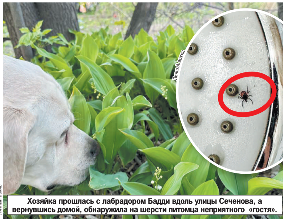
Хозяйка прошла с лабрадором Бадди вдоль улицы Сеченова, а вернувшись домой, обнаружила на шерсти питомца неприятного «гостя».

Сибирячка недоумевает: откуда он взялся? Хозяйка не ходила с псом по лесу или там, где много деревьев.