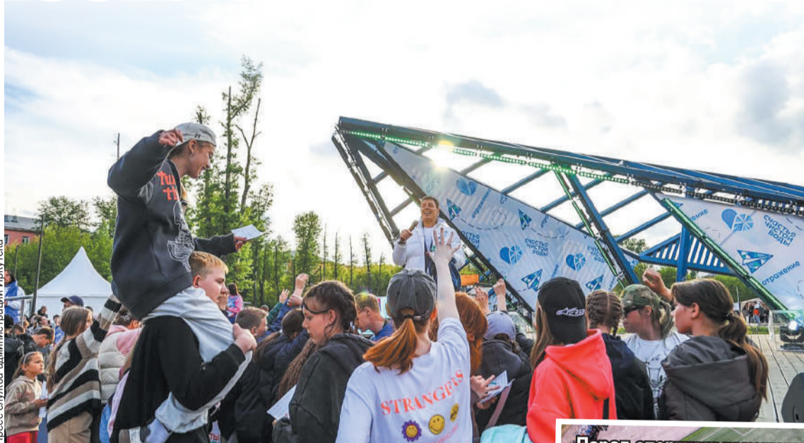
Игра «Музыкальное лото» собрала около 2 тысяч участников.