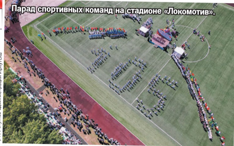
Парад спортивных команд на стадионе «Локомотив».

Развлечение нашлось для каждого. В 10 часов утра - массовая зарядка под руководством опытных тренеров. К ней присоединились более 100 любителей здорового образа жизни. Потом местные жители и гости могли посетить сразу несколько лока-