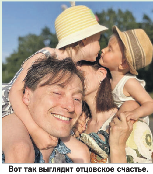
Вот так выглядит отцовское счастье.