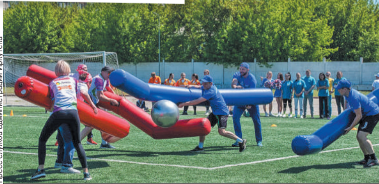
Команды соревновались в неолимпийских видах спорта, например гигантском хоккее.

- Сегодня прошло главное спортивное событие Ленинского округа - «Большая игра. 105-й РАУНД». Между командами разыгралась нешуточная борьба: каждый приложил максимум усилий, чтобы показать высокие результаты. Благодаря всем, кто помог в