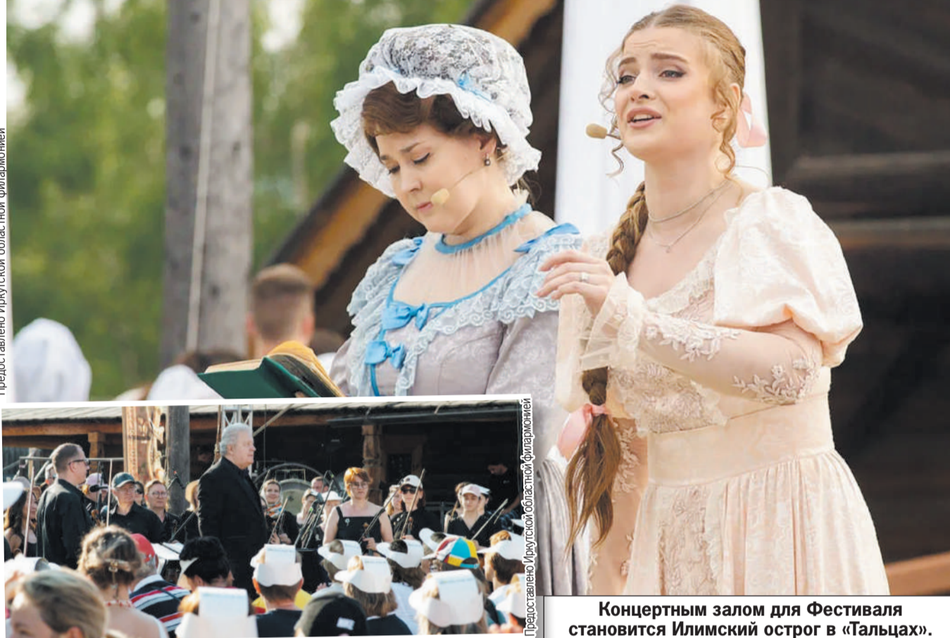
Концертным залом для Фестиваля становится Илимский острог в «Тальцах».