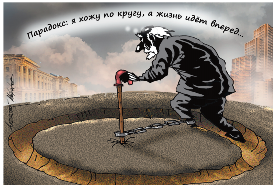
Парадокс: я кошу по кругу, а жизнь идет вперед...