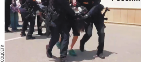
«Чтобы о наших близких не забыли», — говорит мама одного из арестованных.

Супержестокое задержание граждан России.