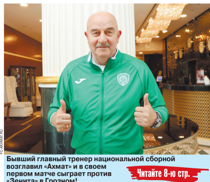
Бывший главный тренер национальной сборной возглавил «Ахмат» и в своем первом матче сыграет против «Зенита» в Грозном!