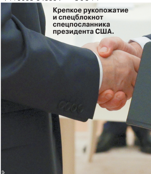
Крепкое рукопожатие и спецблэктоут спецпосланника президента США.